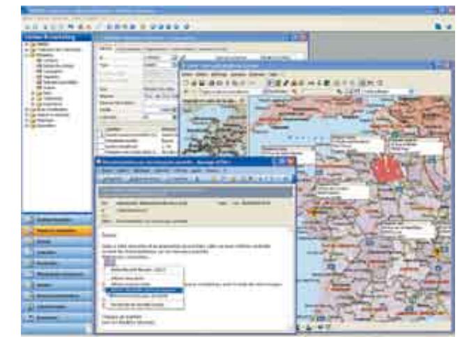
Microsoft Dynamics NAV vous donne des réponses exclusives aux enjeux de votre entreprise

Les fonctions décisionnelles intégrées, la gestion d'alertes, l'instauration de portails employés... Ces solutions innovantes offrent à la fois plus de réactivité et une meilleure communication dans une logique collaborative, un accès facilité aux données critiques de l'entreprise et une meilleure prise de décision.