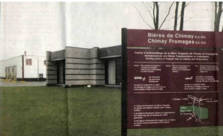
Pour préserver la quiétude de l'abbaye de Scourmont, les visites se font uniquement au zoning de Bailleux où est embouteillé et expédié le précieux breuvage, 317831