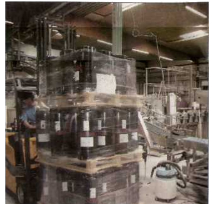
La production de Triple en fût, à destination de l'Horeca local, reste marginale. 317825