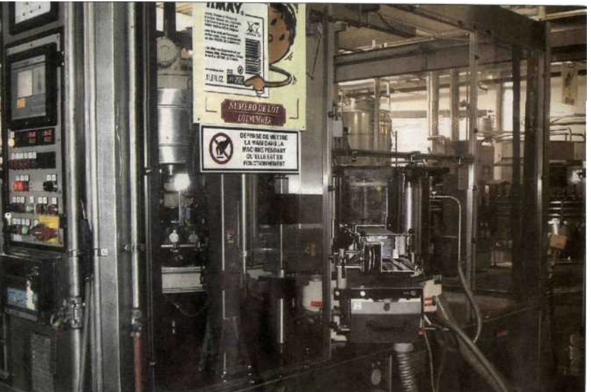
L'étiquetage est un bon exemple du bénéfice attendu du nouveau système Informatique. Jusqu'à présent, les stocks d'étiquette étaient gérés manuellement. Dorénavant, la gestion de ces bordereaux sera Informatisée pour mieux coller à la demande. 317823