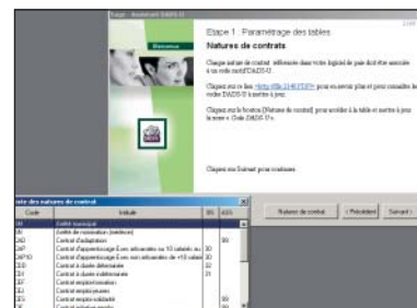
Démo déroulante sur www.cyborg.fr