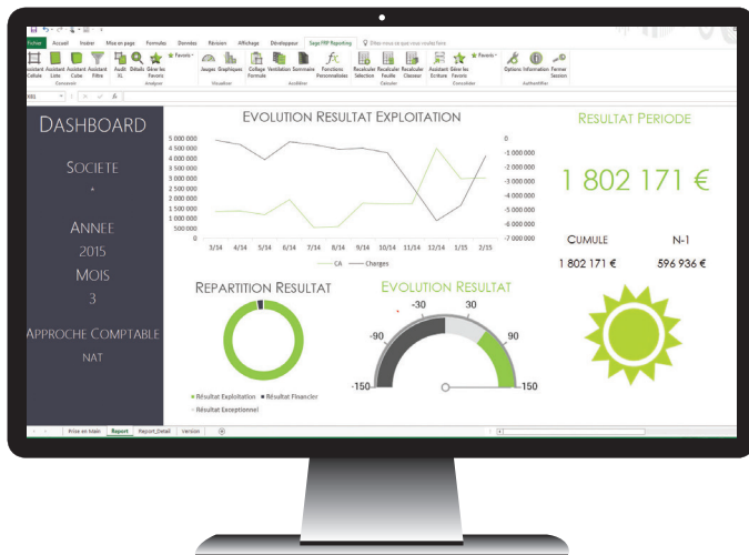
Dashboard du Résultat d'exploitation